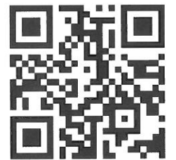
山口県ひとつづくり財団HP