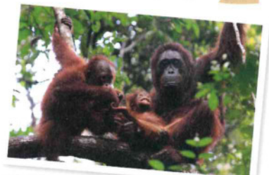
森の人 ボルネオオランウータンの家族(ボルネオ島)

東南アジアのボルネオオランウータン、オーストラリアのウォンバット、北アメリカのシロイワヤギ、アフリカのチーター・アフリカツウ、フォークランドのイワトビペンギン、日本のニホンリスなど動物たちの子育てを写真と映像で紹介。剥製や実物大写真で形態や大きさも体感。