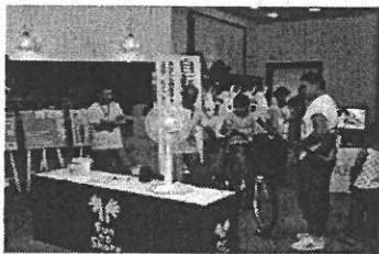
【地域イベント出展への協力】